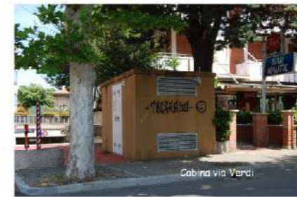
9 CABINA VIA VERDI