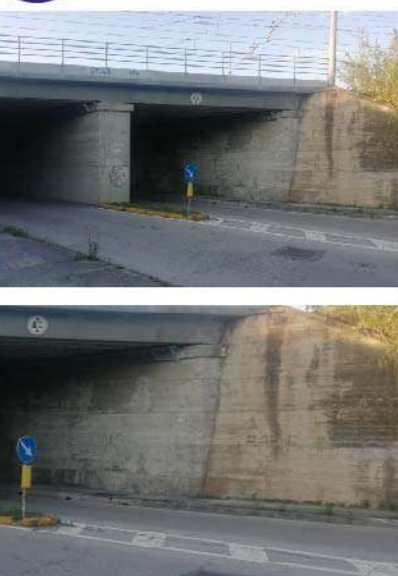
17 SOTTOPASSO VIA INDIPENDENZA