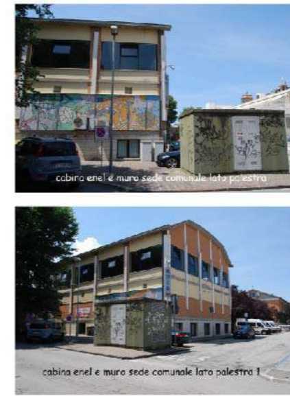
8 CABINE ELETTRICHE VIA DEL PORTO