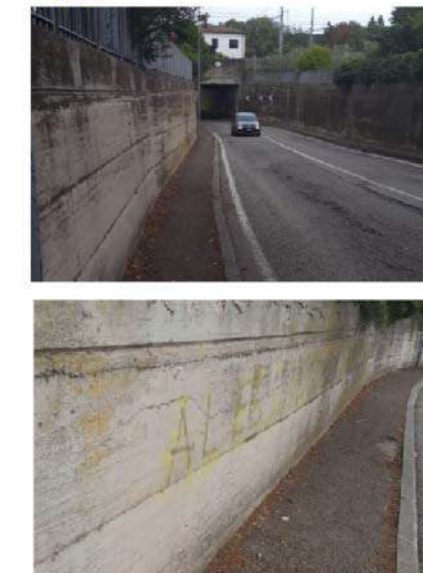
15 SOTTOPASSO VIA PANTANO