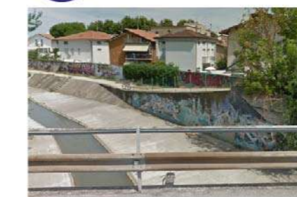
22 LUNGO VENTENA VIA E. ROMAGNA