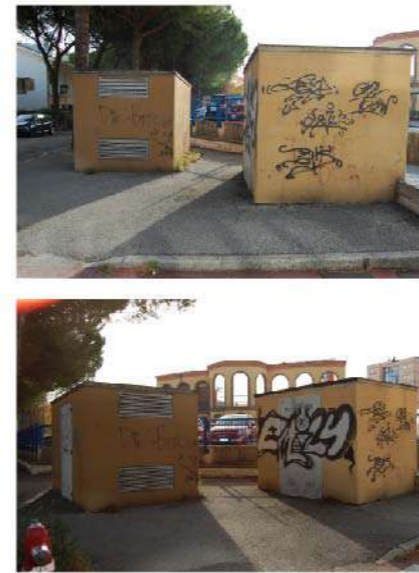
3 CABINE ELETTRICHE PZZA REPUBBLICA