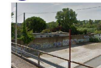
23 LUNGO VENTENA CORSO ITALIA