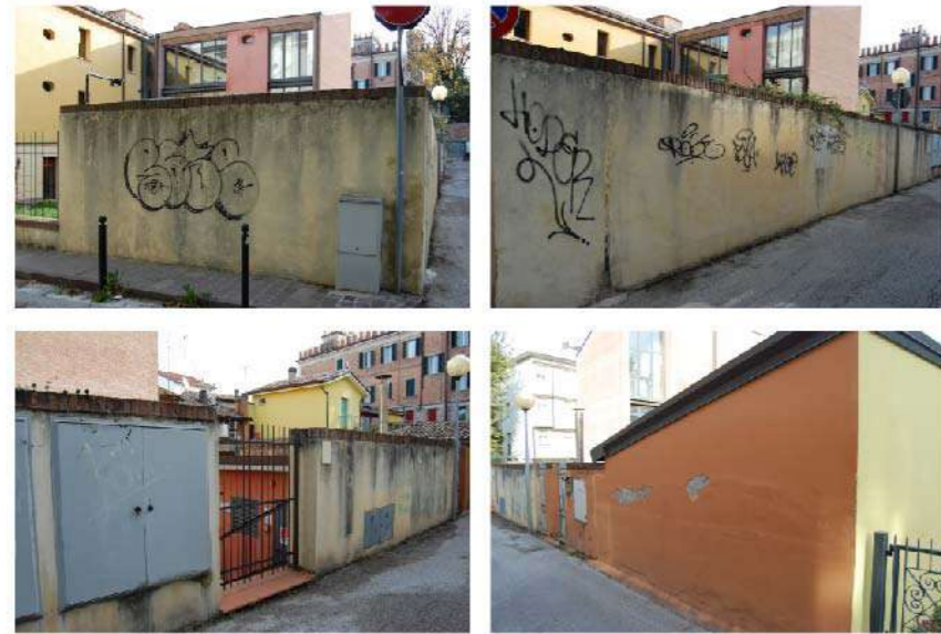
1 PARETE MUSEO LATO LAVATOIO