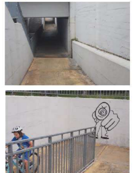
16 SOTTOPASSO STAZIONE