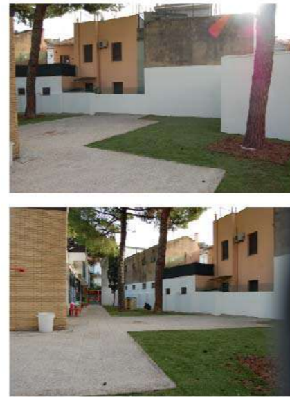
2 ASILO CORRIDONI