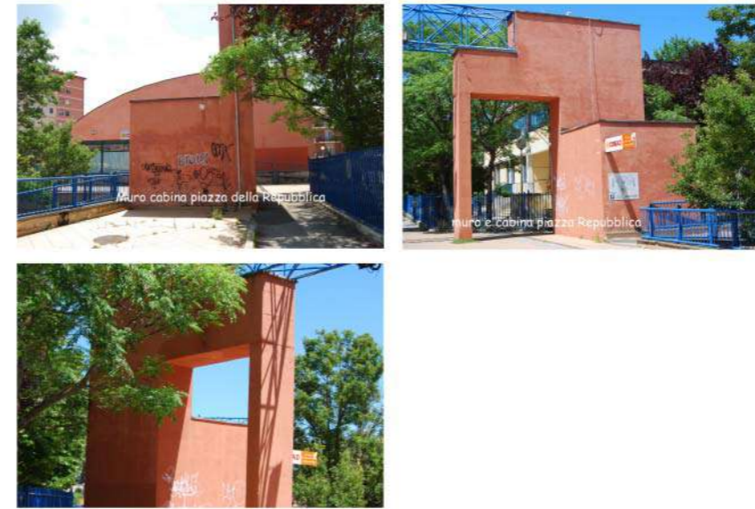
4 MURO INGRESSO PIAZZA REPUBBLICA