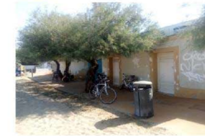
5 EDIFICIO BAGNI E DOCCE SPIAGGIA