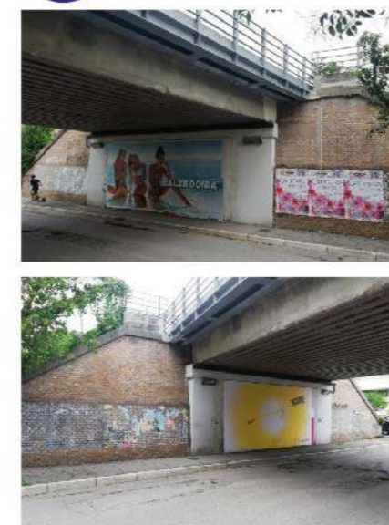
19 SOTTOPASSO VIA FERRARA