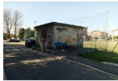
11 CABINA ELETTRICA TORCONCA