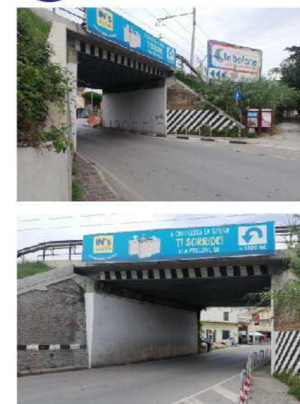
18 SOTTOPASSO VIA E.ROMAGNA