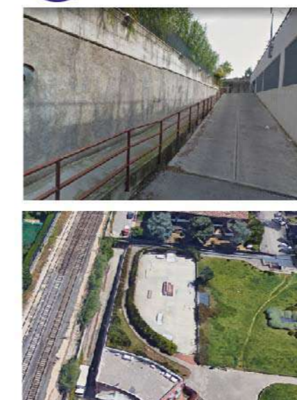
21 MURI RAMPE LARGO DELLA PACE/PARCO