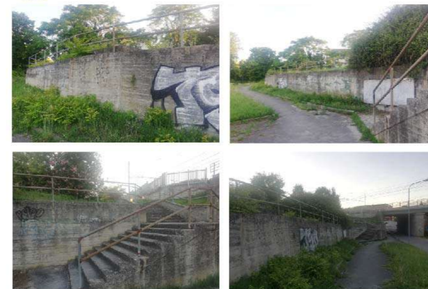
14 MURI E SCALE VIA INDIPENDENZA