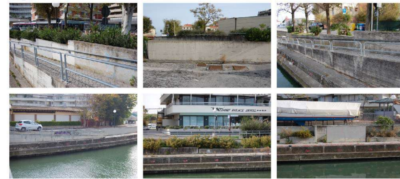
7 MURI INGRESSI CANALE VENTENA