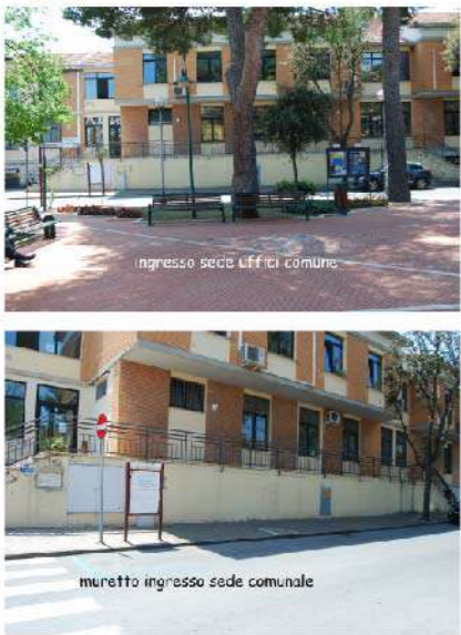
10 MURO UFFICI COMUNALI 2