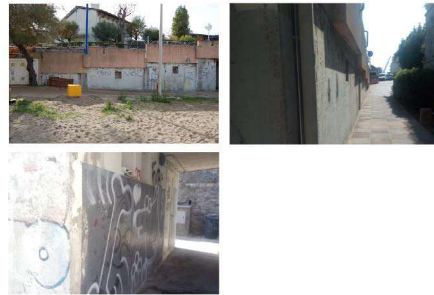
6 MURA INIZIO PASSEGGIATA