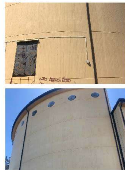
12 INGRESSO ARTISTI TEATRO