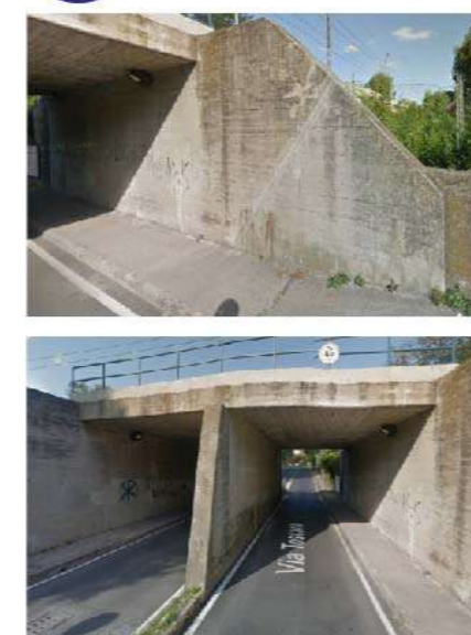
20 SOTTOPASSO VIA TOSCANA