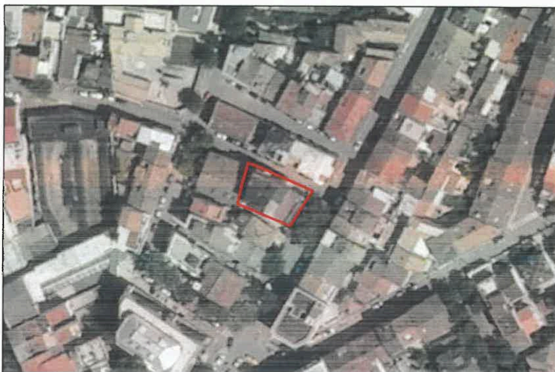
INDIVIDUAZIONE CATASTALE E SU ORTOFOTO AGEA 2011 SCHEDA: 19 - Hotel Lena SCALA 1:1000