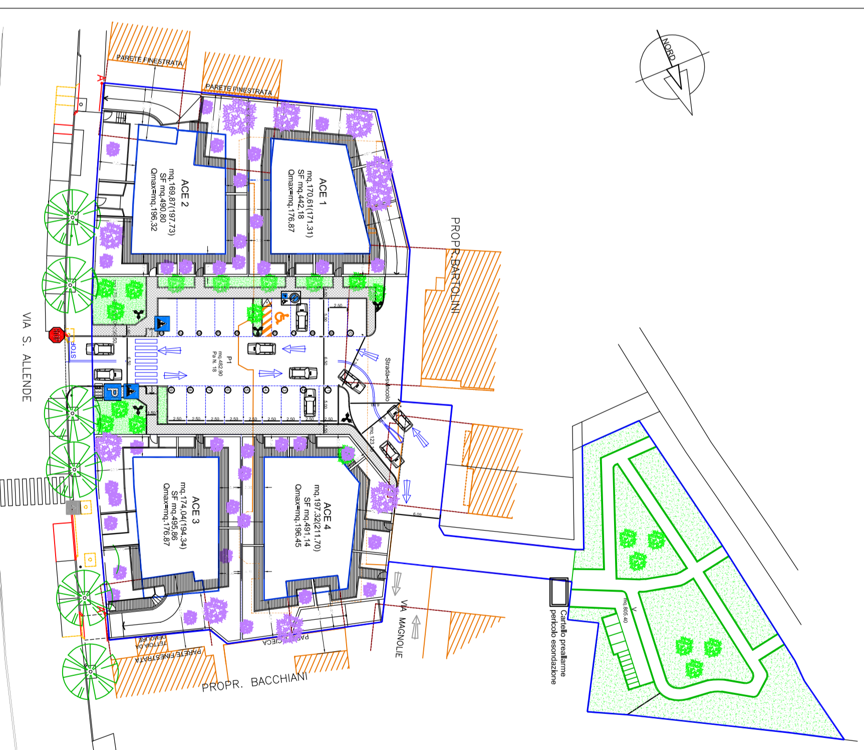
PLANIMETRIA GENERALE DI PROGETTO SCALA 1:1500