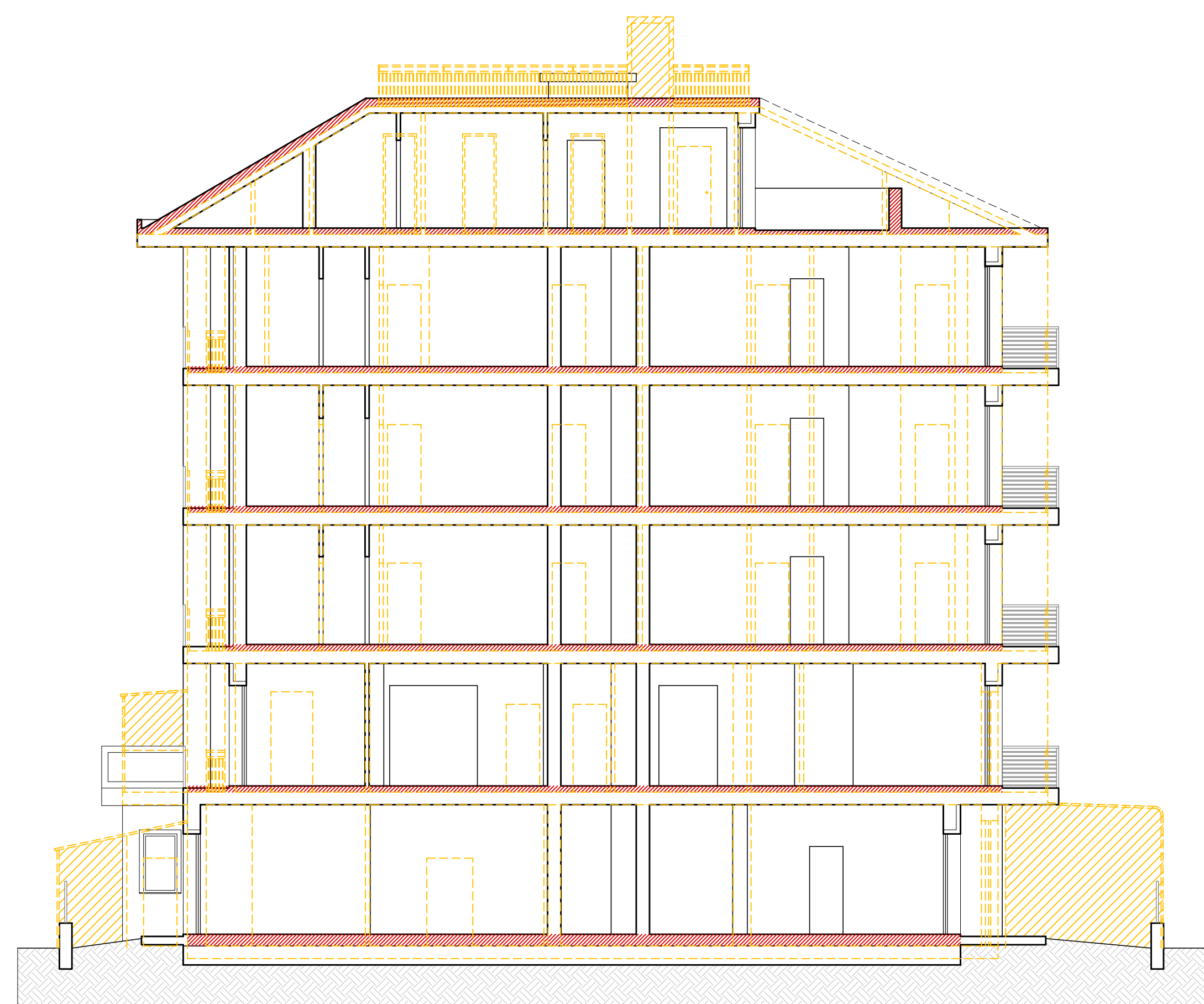
SEZIONE B - B