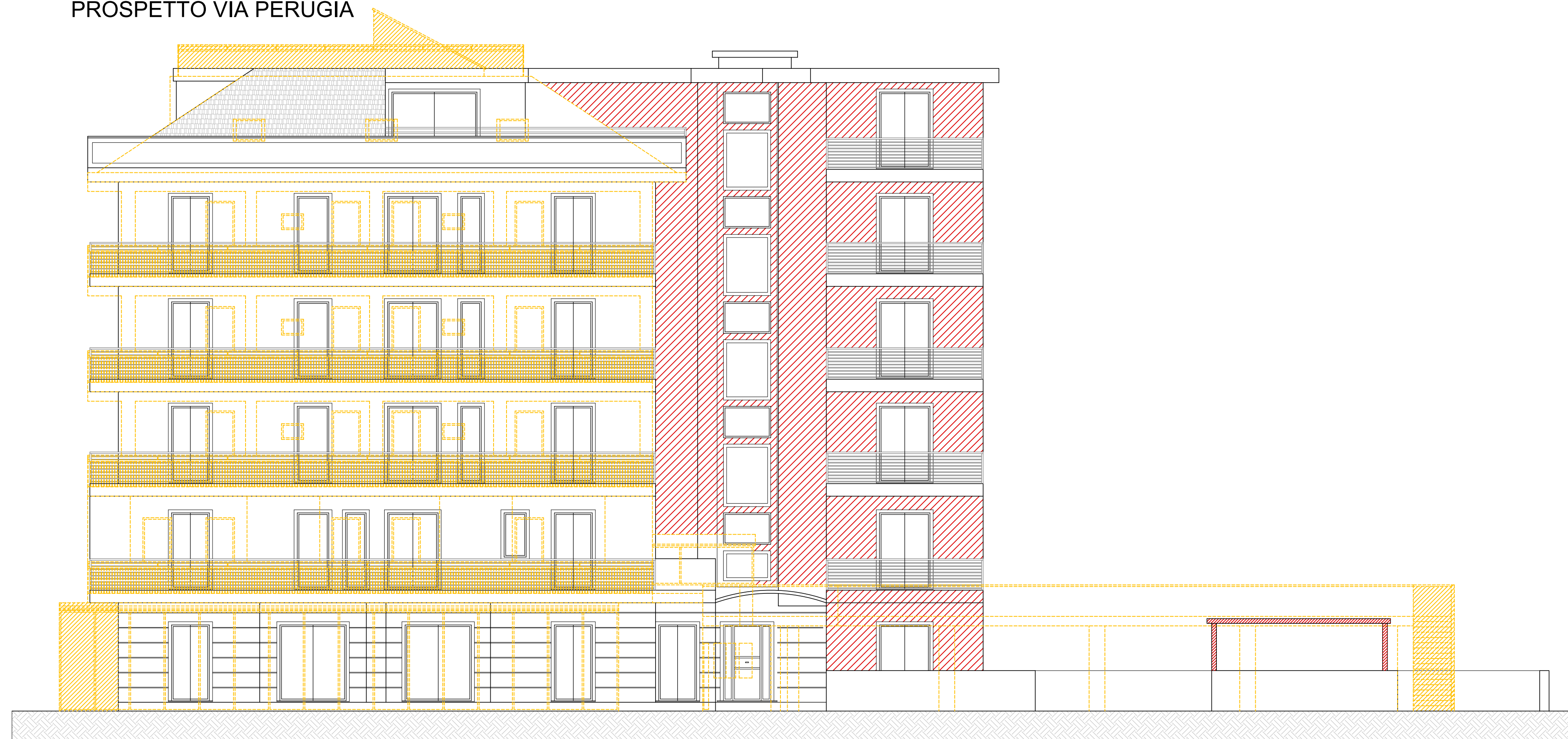
- LEGENDA -